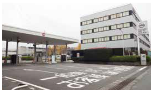
日産車体工場入口

高速道路よりお越しの場合 ・圏央道 寒川南ICから 約10分 ・中央道 甲府南ICから 約1時間30分 ・関越道 川越ICから 約1時間10分